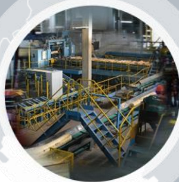
«Свеза» в Костроме (г. Кострома)