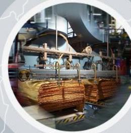
«Свеза» в Тюмени (г. Тюмень)