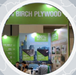
«Свеза-Лес» (г. Санкт - Петербург)