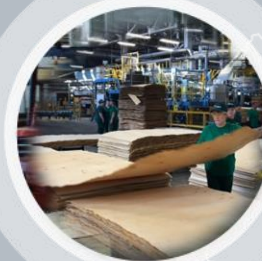
«Свеза» в Верхней Синячихе (п. Верхняя Синячиха, Свердловская обл.)