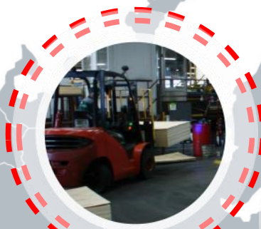
«Свеза» в Новаторе (п. Новатор, Вологодская обл.)