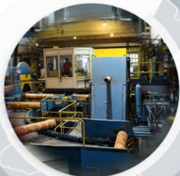
«Свеза» в Усть-Ижоре (п. Понтонный, г. Санкт-Петербург)

«Свеза» в Новаторе – самый крупный работодатель и налогоплательщик района.