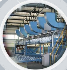
«Свеза» в Уральском (п. Уральский, Пермский край)