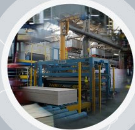
«Свеза» в Мантурове (г. Мантурово, Костромская обл.)