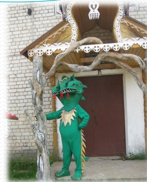
«ГАДОВО – Родина Змея Горыныча», музей Гадов