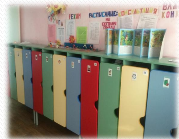
в 2019 году закуплены шкафчики для одежды и кровати

С 2016 года реализуется муниципальная программа по созданию образовательной, безопасной и развивающей среды в дошкольных учреждениях Кимрского района