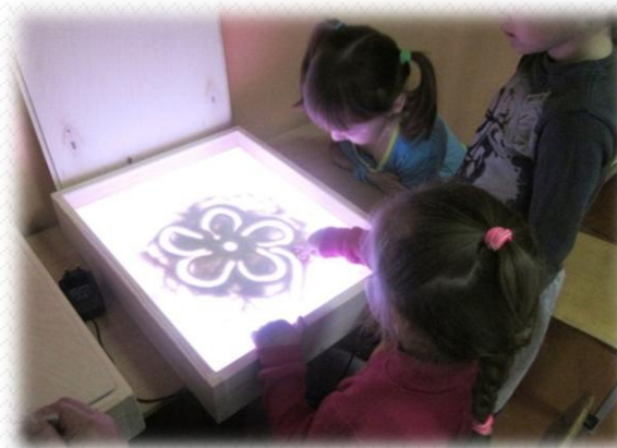
в 2018 году закуплено развивающее оборудование