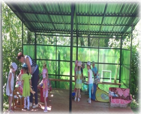
в 2016 году установлены прогулочные веранды