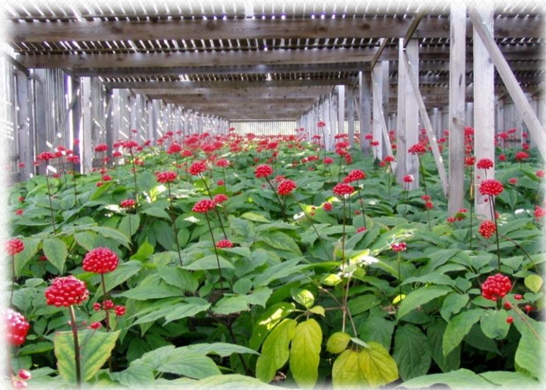
Крестьянско-фермерское хозяйство «ПАНАКС»

В нашем районе есть свой Алтай, Растет корень жизни в деревне Крева. Женьшень плантация – вот красота, Растениеводам – честь и хвала!