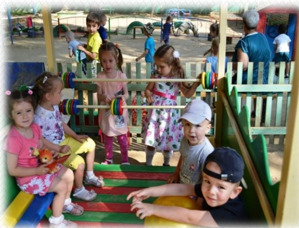
в 2017 году приобретено и установлено игровое оборудование