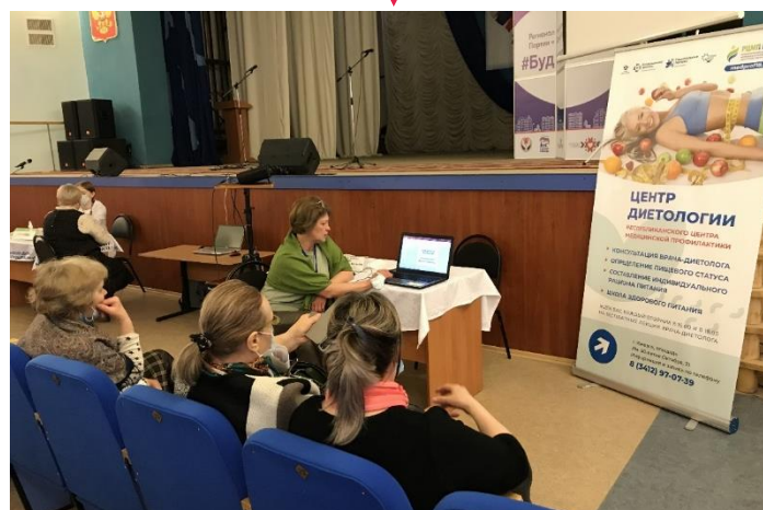
Проведение занятий в Школах здоровья для населения