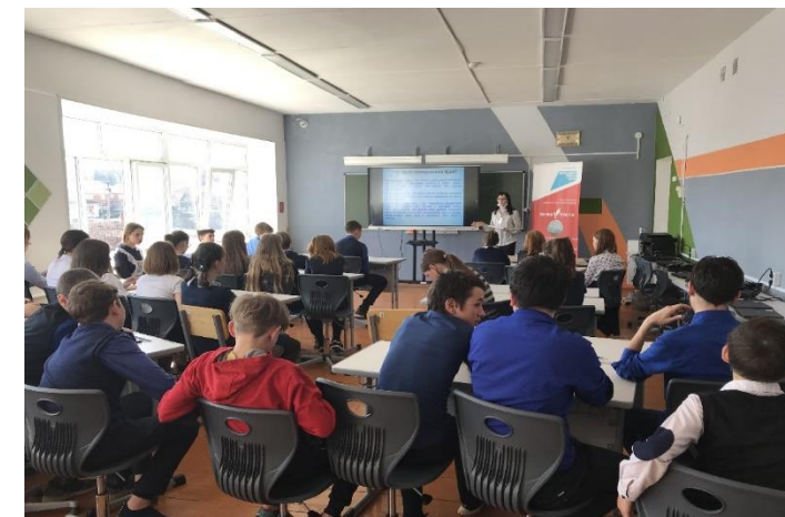
Уроки здоровья для учащихся образовательных учреждений