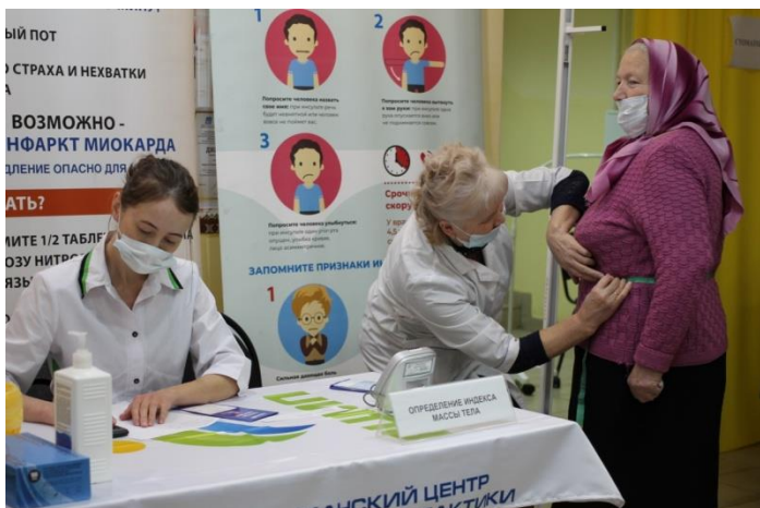
«Улица здоровья» – скрининг ХНИЗ