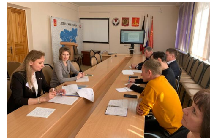
Проведение Круглых столов с представителями МО