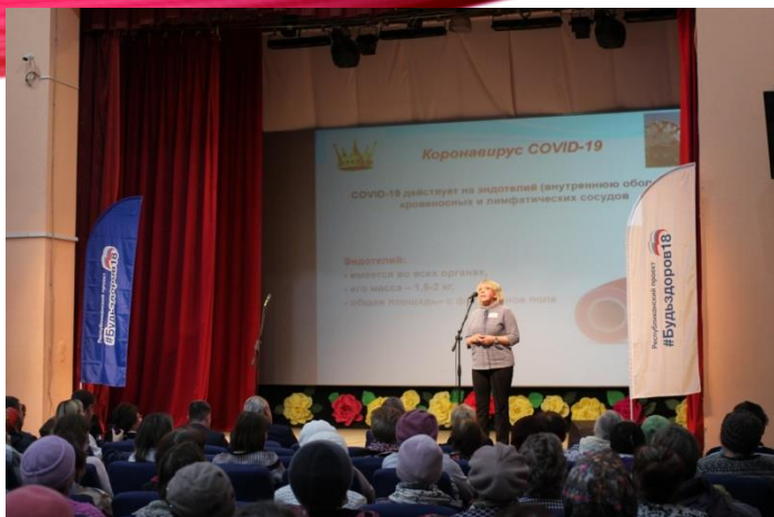
Проведение лекции и оздоровительной зарядки для населения