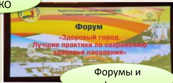
Форумы и конференции