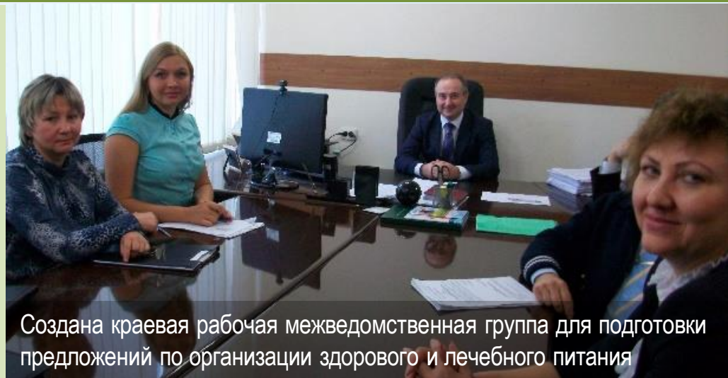
Создана краевая рабочая межведомственная группа для подготовки предложений по организации здорового и лечебного питания

Пилотный проект «Здоровое питание — здоровое жизнь» при методологической поддержке офиса ВОЗ в России