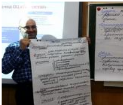
ОБЪЕДИНЕНИЕ ИНТЕЛЛЕКТУАЛЬНЫХ РЕСУРСОВ