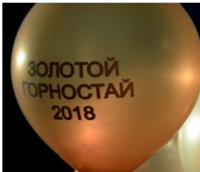
ВМЕСТЕ К ОДНОЙ ЦЕЛИ