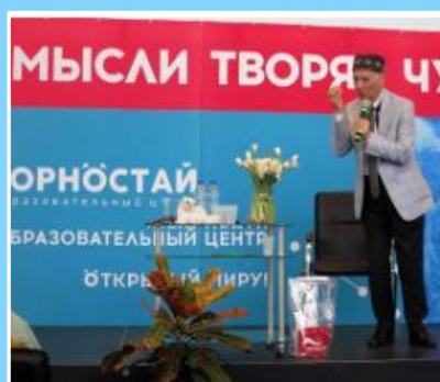
ГУМАННАЯ ПЕДАГОГИКА – СТРАТЕГИЯ ОБЩЕНИЯ ВСЕХ ЗС