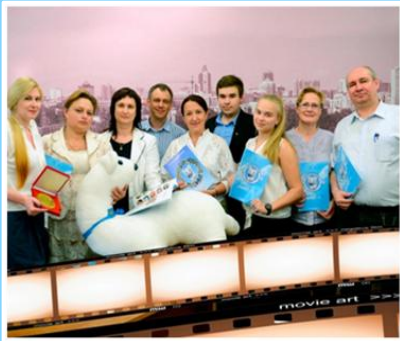
ГОСУДАРСТВЕННО- ОБЩЕСТВЕННОЕ УПРАВЛЕНИЕ