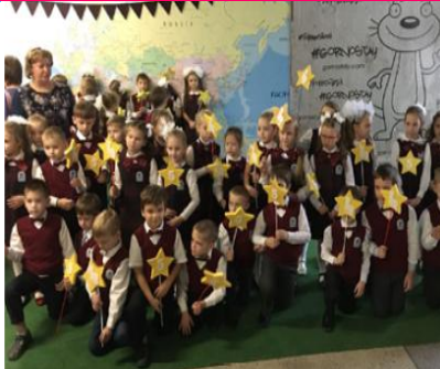
ИНИЦИАТИВА ДЕТЕЙ И ВЗРОСЛЫХ