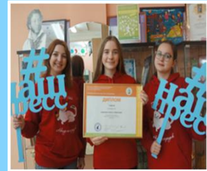
МЕДИАОБРАЗОВАНИЕ – ГУМАНИТАРНАЯ И КОММУНИКАТИВНАЯ СОСТАВЛЯЮЩАЯ