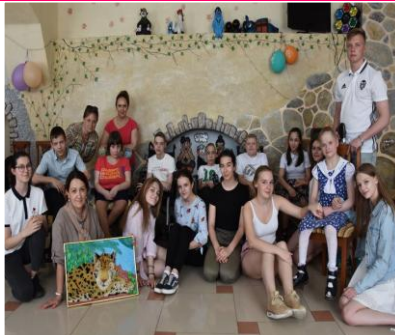
ВЫСТРАИВАНИЕ ДОВЕРИЯ МЕЖДУ ДЕТЬМИ И ВЗРОСЛЫМИ