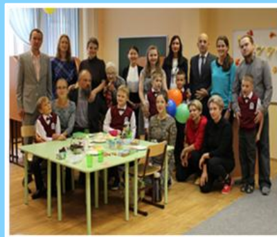
ИНКЛЮЗИЯ (РАС) – ГУМАНИСТИЧЕСКАЯ И ДУХОВНАЯ СОСТАВЛЯЮЩАЯ