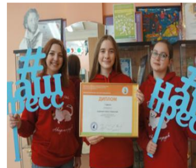
ОТКРЫТОСТЬ К ОБЩЕНИЮ