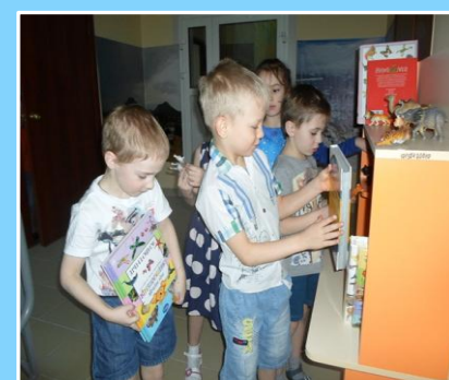
ДОШКОЛЬНОЕ ОБРАЗОВАНИЕ КАК ПРОПЕДВИКА ОБЩЕГО ОБРАЗОВАНИЯ