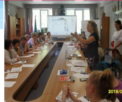
СОТРУДНИЧЕСТВО (КОРПОРАТИВНЫЕ МЕРОПРИЯТИЯ ДЕТЕЙ И ВЗРОСЛЫХ)