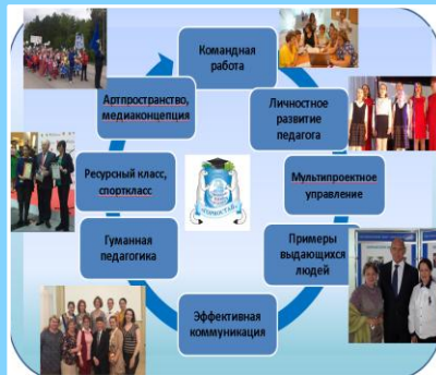
МУЛЬТИПРОЕКТНОСТЬ – ШИРОКИЙ СПЕКТР НАПРАВЛЕНИЯ РАЗВИТИЯ