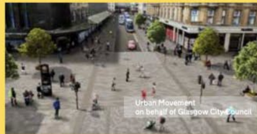
Figure 21. Example of a SUDS segregated cycle track