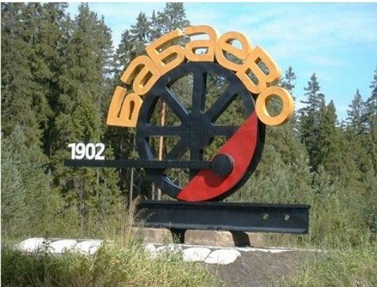
Въезд в город