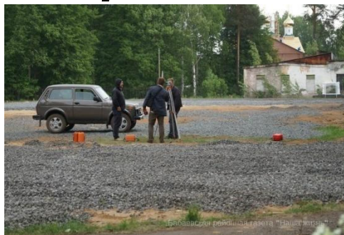
Строительство мини-стадиона у МБОУ «Бабаевская сош №65»