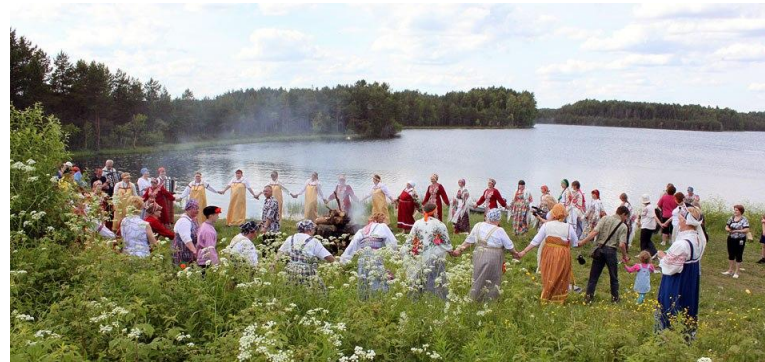
Вепсы – одна из коренных малочисленных народностей России