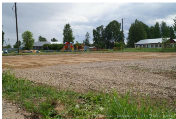
Строительство футбольного мини-стадиона в поселке леспромхоза г.Бабаево