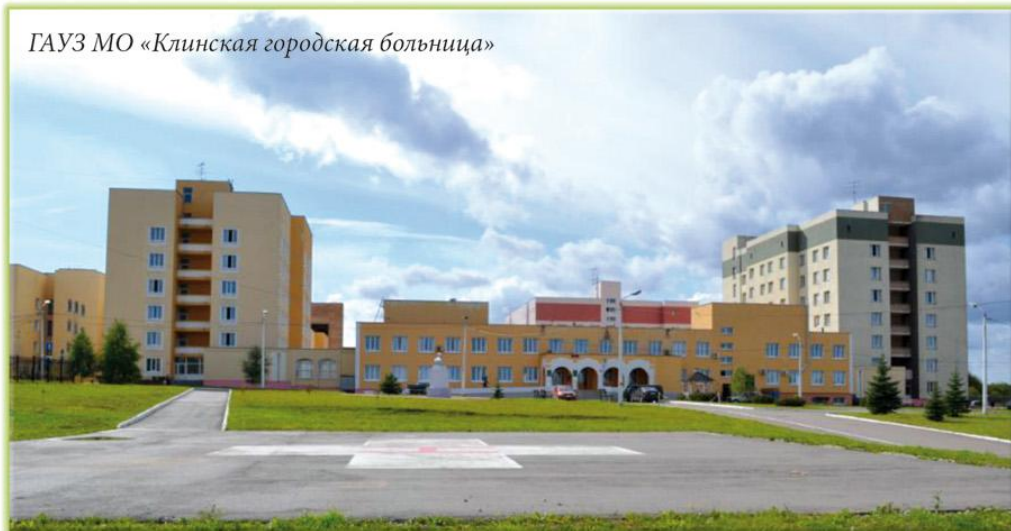
ГАУЗ МО «Клинская городская больница»

Центр здоровья Клинской городской больницы создан в 2010 году в рамках национального проекта «Здоровая Россия» для скрининговых обследований взрослого населения, проведения профилактических консультаций диспансерных пациентов и пропаганды здорового образа жизни. Центр здоровья был признан лучшим центром здоровья для взрослых по Московской области в 2015 году.