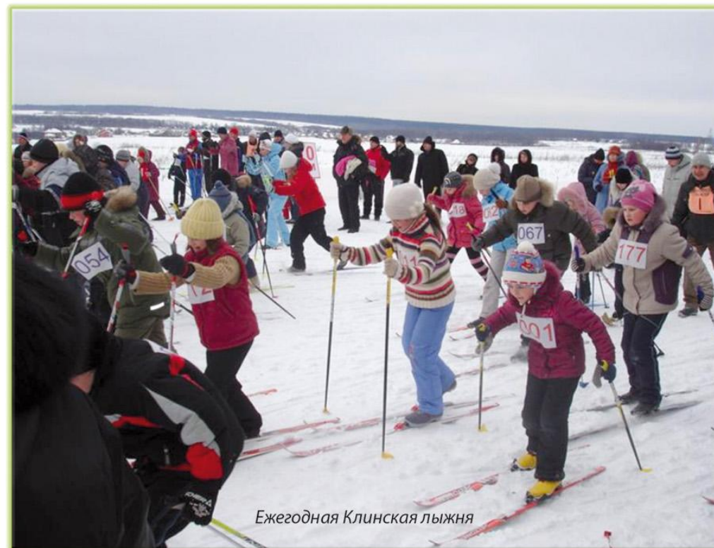
Ежегодная Клинская лыжня